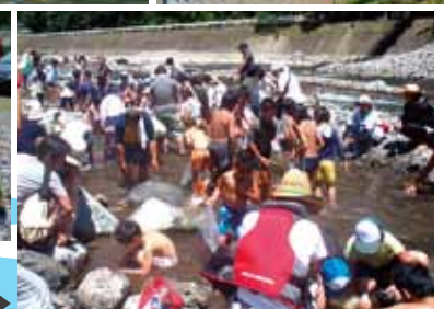
ニジマスのつかみ取り▶