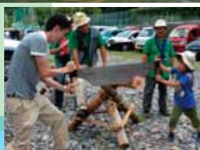
▲のこぎり体験丸太切り